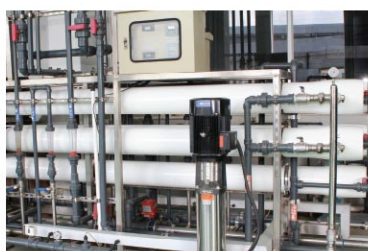
含镍废水处理设备