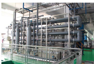
无机废水处理设备